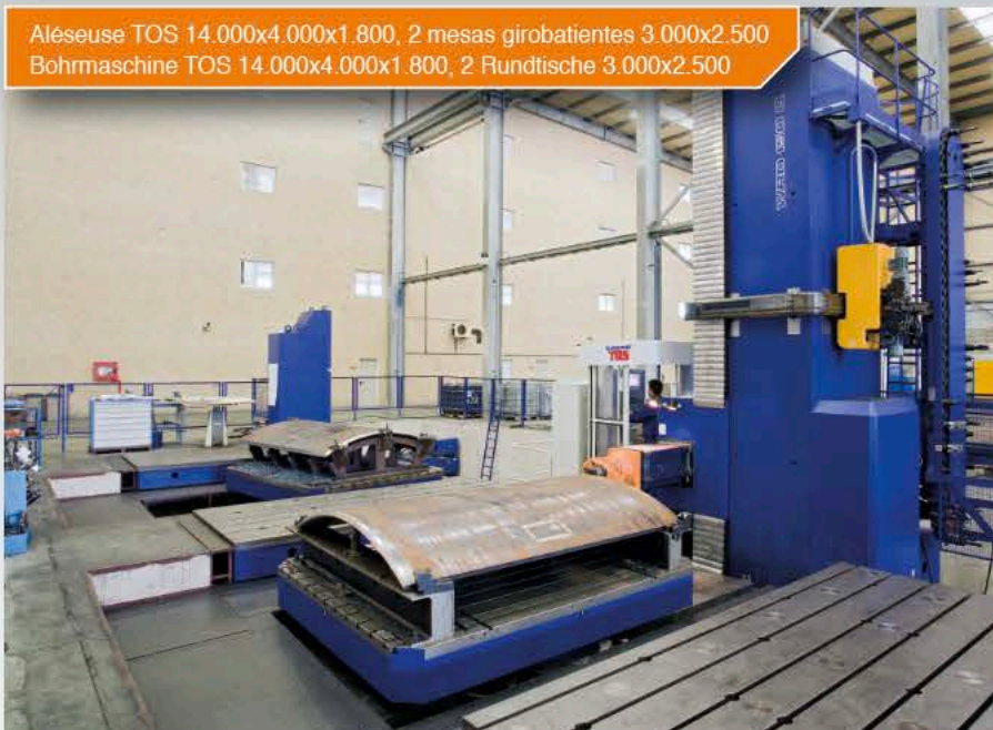
Aléseuse TOS 14.000x4.000x1.800, 2 mesas girobatientes 3.000x2.500 Bohrmaschine TOS 14.000x4.000x1.800, 2 Rundtische 3.000x2.500