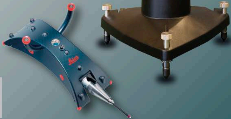
LEICA ABSOLUTE TRACKER AT960-TR