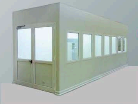
SALLE DE MÉTROLOGIE / MESSRAUM