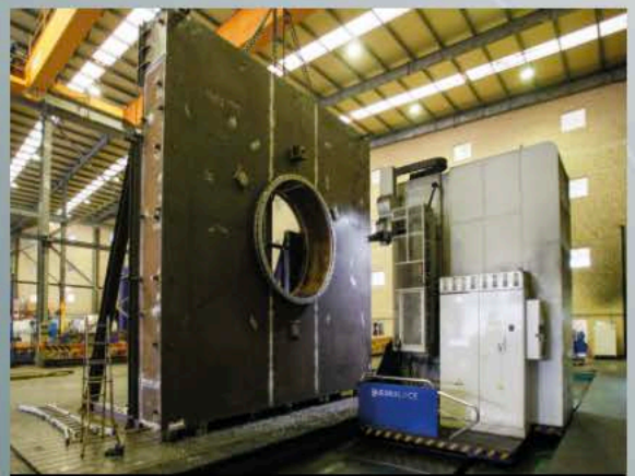
Grues | Kräne