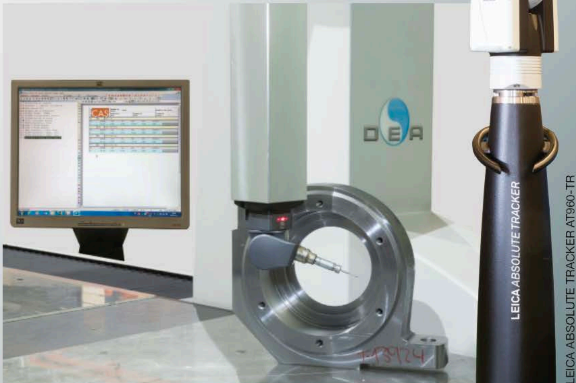
DEA 3D 1.200x3.000x1.000