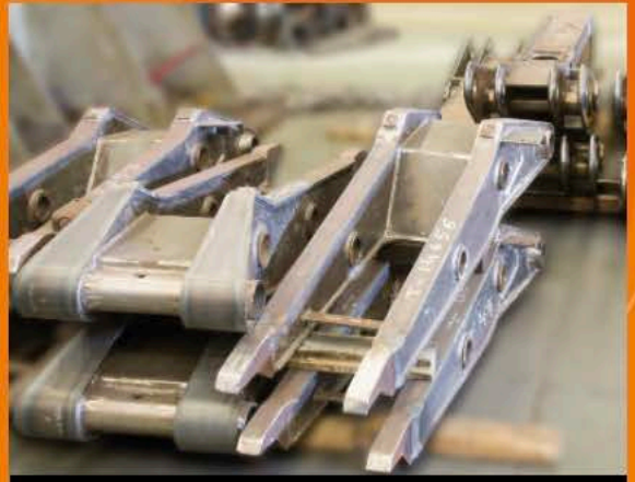
Défense | Rüstungsindustrie