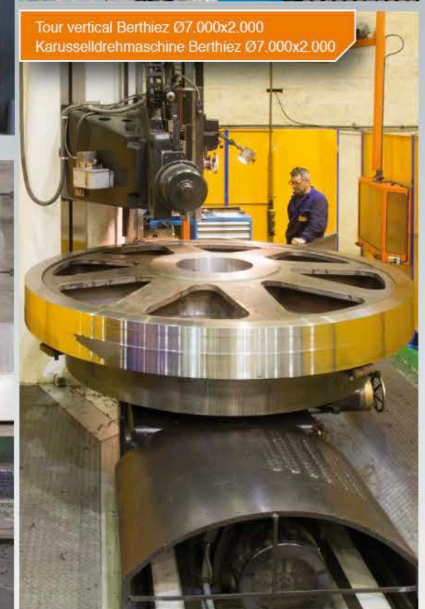
Tour vertical Berthiez Ø7.000x2.000 Karusselldrehmaschine Berthiez Ø7.000x2.000