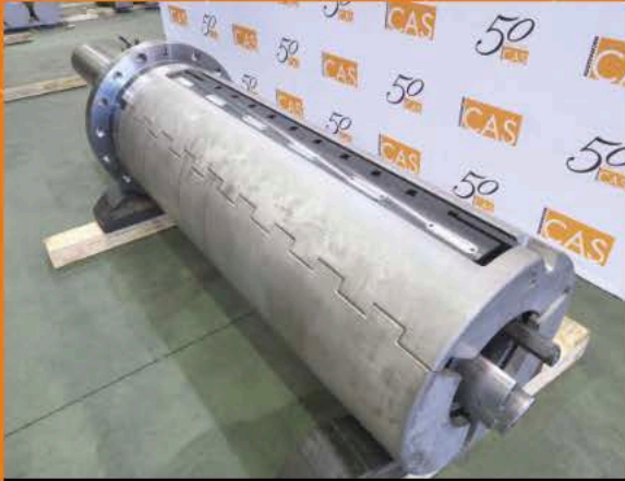
Sidérurgie | Stahlindustrie