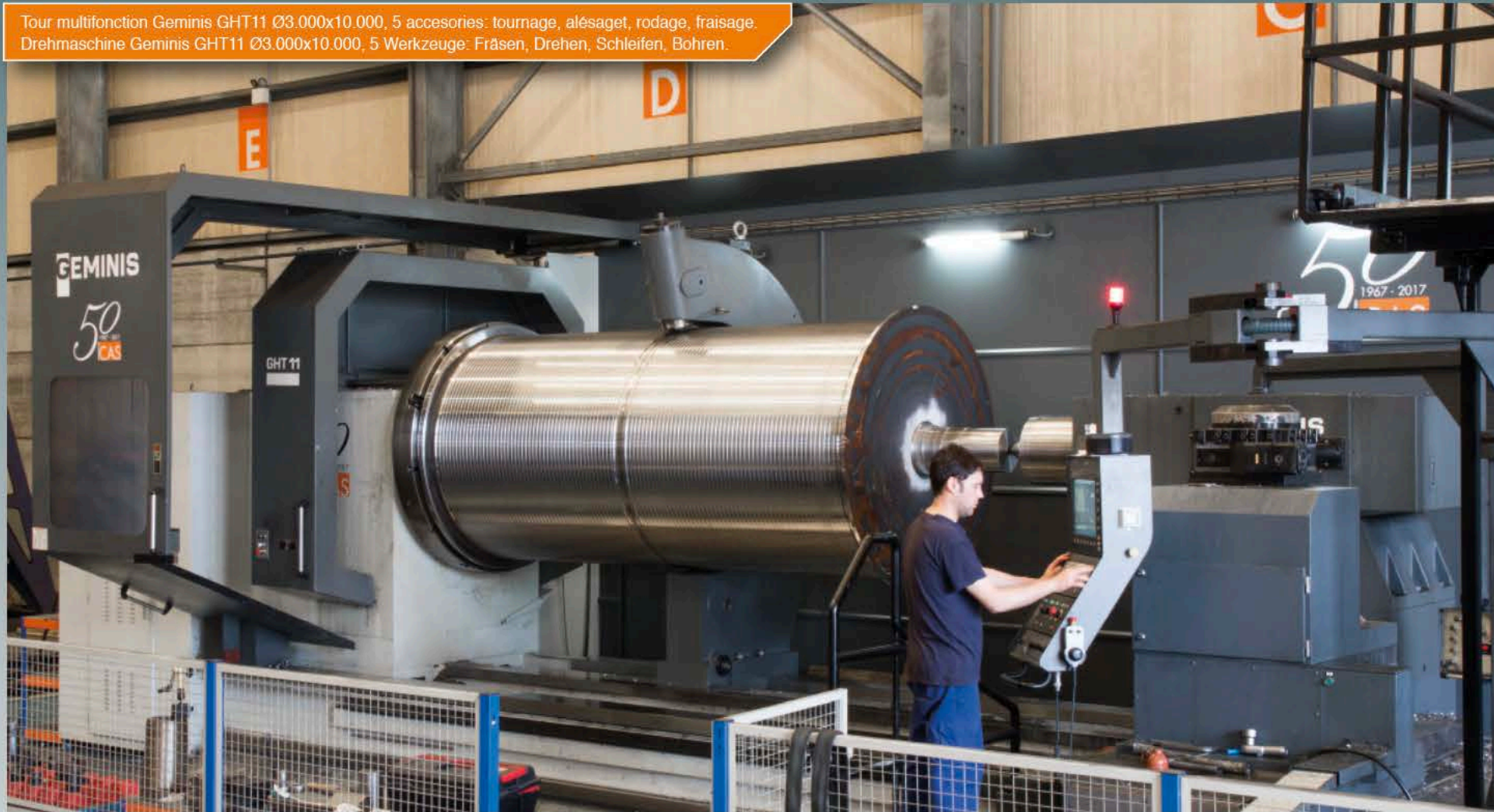
Tour multifonction Geminis GHT11 Ø3.000x10.000, 5 accesories: tournage, alésaget, rodage, fraisage. Drehmaschine Geminis GHT11 Ø3.000x10.000, 5 Werkzeuge: Fräsen, Drehen, Schleifen, Bohren.