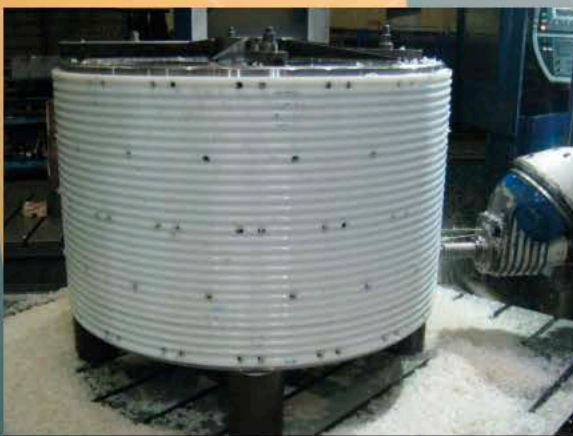
Minier | Bergbau